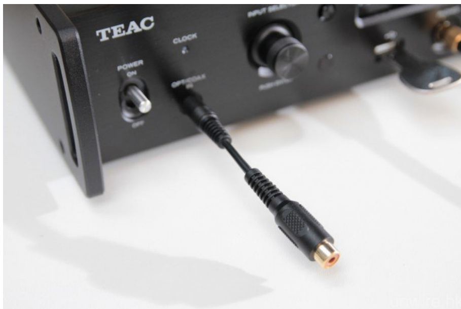
機面還設有 3.5mm 同軸/光纖輸入端子，隨機附送同軸/3.5mm 轉插。

(UD-503 有兩組，可連接平衡耳機) 亦會受助於 TEAC-HCLD 線路，令它足以驅動高達 600ohms 的高阻抗耳筒，實試連接 K612 PRO 亦足以驅動得到。