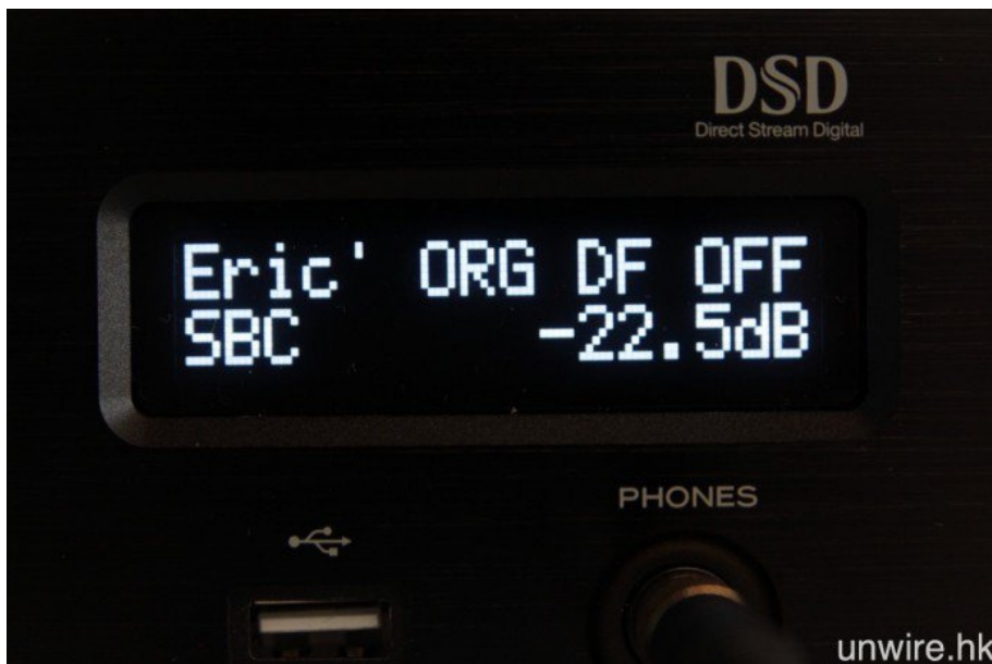
藍牙連線則支援 aptX、SBC 及 AAC 解碼。