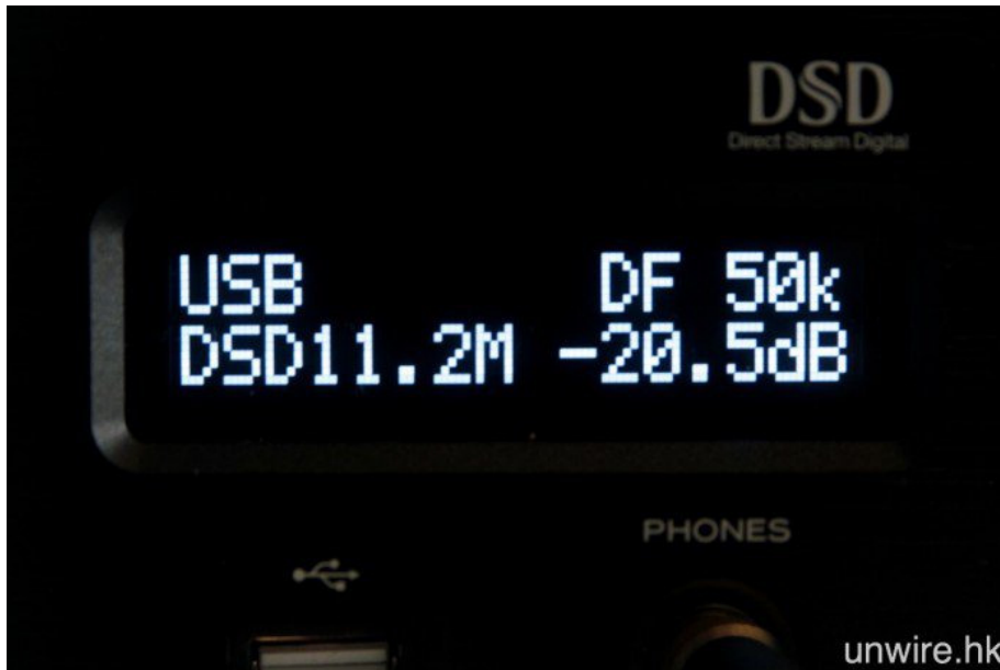
USB-DAC 功能最高支援 32bit/384kHz PCM 及 11.2MHz DSD 訊號。